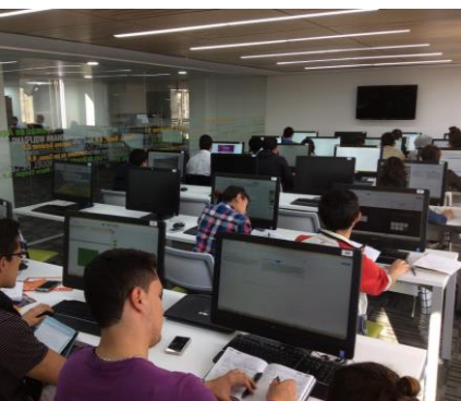
Foto: Sala de formación Bogotá

Administra, preserva, almacena y difunde toda la producción académica, intelectual, científica y administrativa de la Universidad Santo Tomás; permitiendo el acceso a la comunidad mundial.